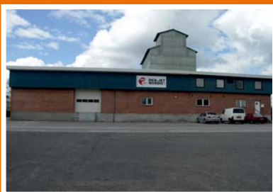
DEN-JET Nordic A/S