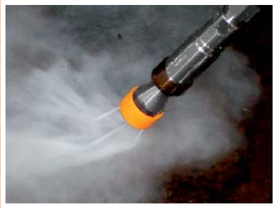
Roterende dysse med 4 skarpe safir dysser.