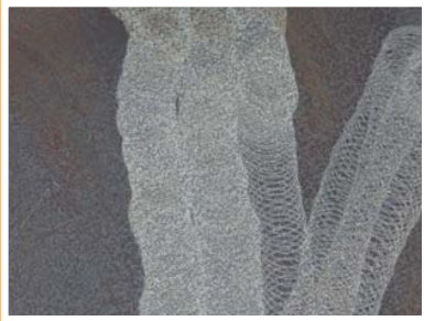
Spuling med roterende dysse.