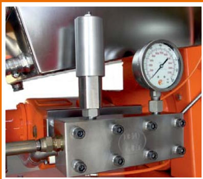
Pumpehovede i rustfaststål.