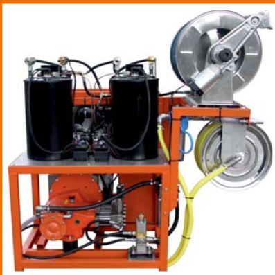
Hedvandskedler Max 500 Bar.