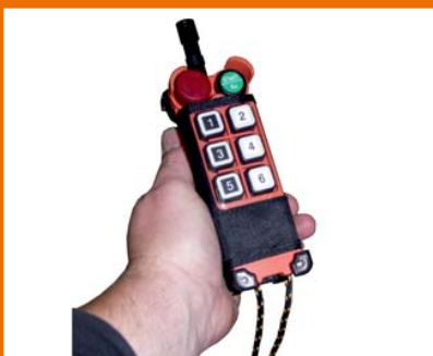
Fjernkontrol, motor og slangeruller.